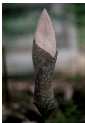
Gambar 8. Bunga kuncup.