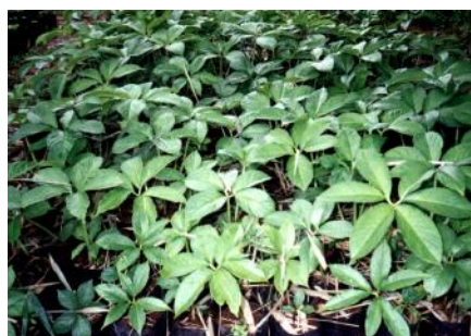
Gambar 1. Bibit umur 2 bst di polibag.