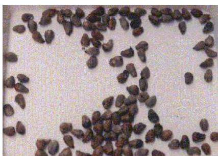
Gambar 5. Biji telanjang.