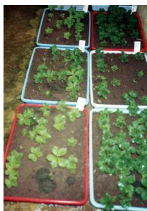
Gambar 7. Bibit di pesemaian.