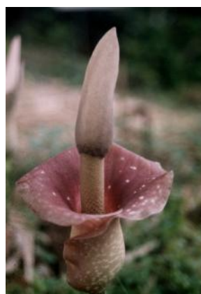
Gambar 9. Bunga mekar penuh.