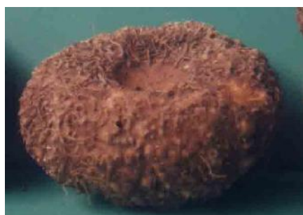
Gambar 4. Umbi hasil panen.