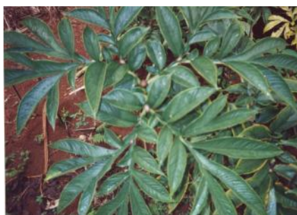
Gambar 2. Tanaman dewasa.