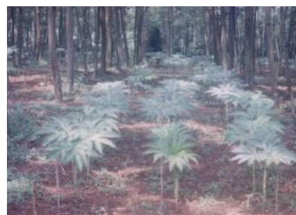
Gambar 3. Tanaman di lapang dua periode tumbuh.