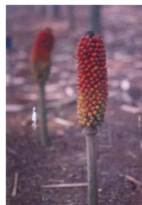
Gambar 10. Buah masak.