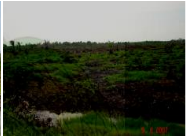
Gambar 2. Kerusakan hutan mangrove akibat penebangan oleh masyarakat di Desa Sei Tuan ( kiri ) dan Desa Rugemuk ( kanan ) (Kecamatan Pantai Labu)