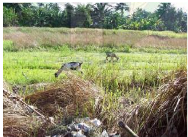
Gambar 4. Sawah di kawasan mangrove Desa Bagan Serdang