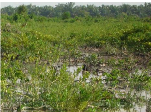
Gambar 3. Kelapa sawit di belakang ekosistem mangrove