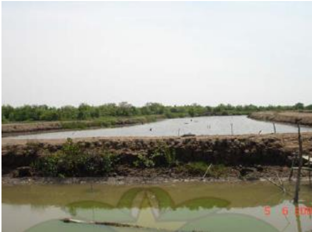
Gambar 5. Tambak-tambak yang memasukkan air dari laut

Kamal et al. (2005) menyebutkan luas hutan mangrove di Sumatera Barat mencapai 39.832 ha dimana hutan mangrove tersebut sudah beralih fungsi sebagai lahan pertanian, pemukiman dan perikanan akibatnya mempermudah terjadinya pencemaran laut oleh bahan pencemar rumah tangga, yang sebelumnya tertahan oleh akar mangrove. Dampak luas dari kerusakan hutan mangrove adalah hilangnya 1 ha hutan mangrove bisa berakibat hilangnya tiga hingga dua belas ton ikan atau udang/tahun dan dapat mengakibatkan pencemaran air laut terus menerus meningkat.