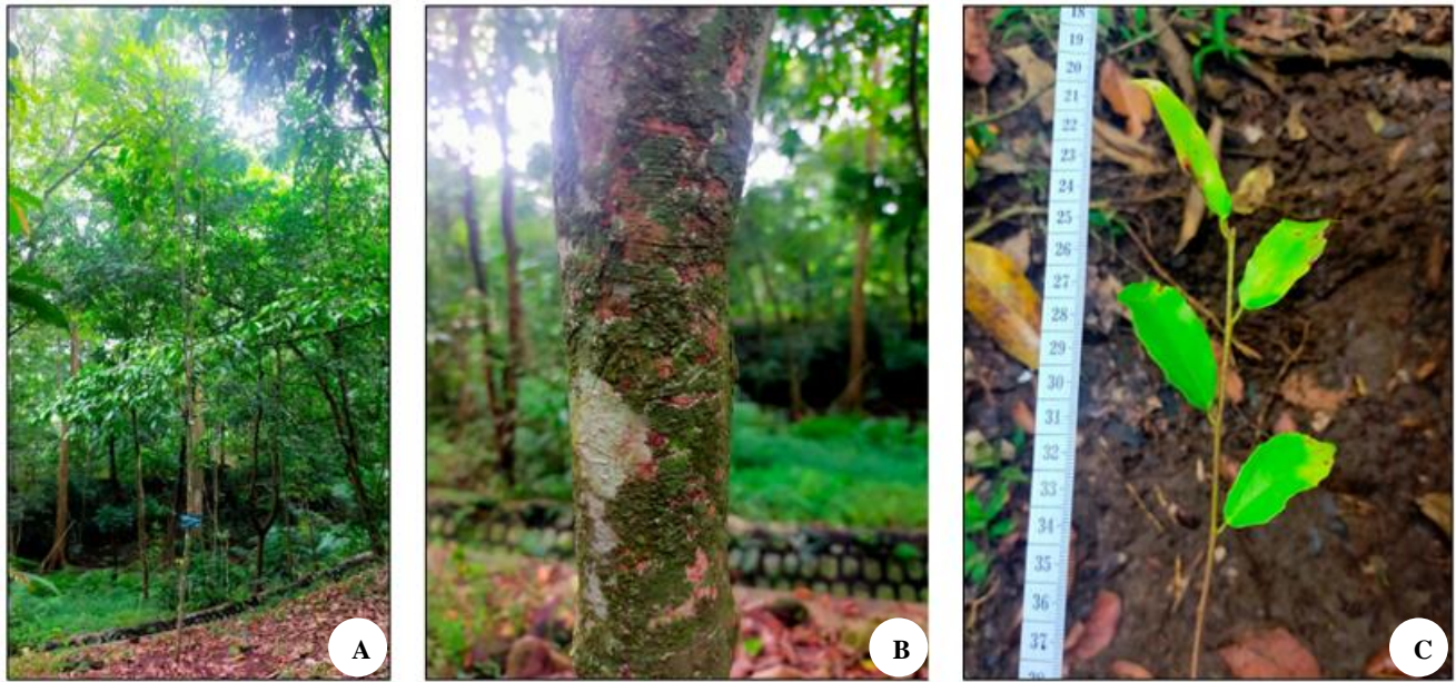
Gambar 4. Morfologi Flacourtia inermis , A. Habitus, B. Tekstur batang, C. Daun