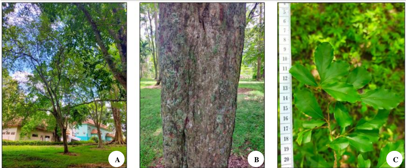
Gambar 5. Morfologi Flacourtia inermis , A. Habitus, B. Tekstur batang, C. Daun

Berdasarkan studi literature F. inermis memiliki kandungan senyawa fitokimia diantaranya yaitu flavonoid, antosianin, karotenoid, tanin dan alkaloid (Jayasinghe et al. 2012). Berdasarkan senyawa yang terdapat pada F. inermis dapat disimpulkan bahwa kandungan antioksidan dari spesies ini sangat tinggi. Antioksidan ini dapat mencegah penuaan dini, Alzheimer, rheumatoid diabetes, katarak, dan randang sendi. Menurut Jayasinghe et al. (2012) sari buah F. inermis mengandung beberapa senyawa diantaranya yaitu caffeoylquinic acid derivatives , methyl 4-O-caffeoylquinic acid , n-butyl chlorogenate , n-butyl 5-O-caffeoylquinic acid , phenolic glucoside , quinic acid , malic acid dan vitamin C yang cukup tinggi sehingga dapat digunakan sebagai penguat daya imun tubuh. pada masyarakat lokal daun F. inermis digunakan sebagai sayuran pendamping makanan atau lalapan. Batang pohon F. inermis juga dapat