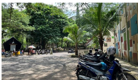
Gambar 11. Area parkir