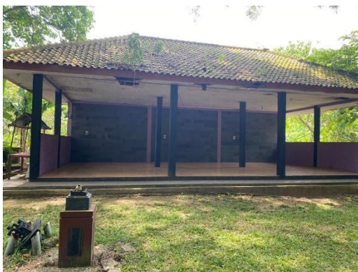
Gambar 7. Pelataran di wisata Way Belerang