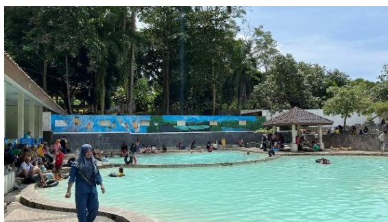
Gambar 4. Pengunjung berendam di kolam air panas