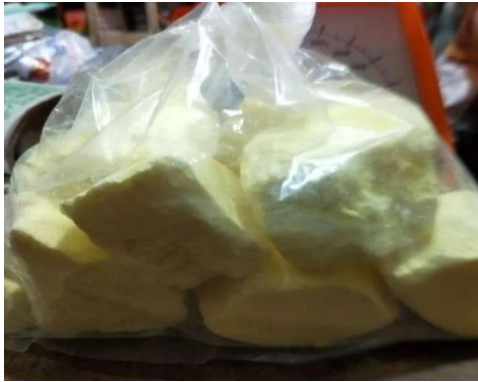
Gambar 6. Sabun yang terbuat dari belerang