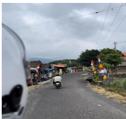
Gambar 13. Akses jalan menuju wisata

Kesimpulan dari penelitian daya tarik wisata yang berada di wisata Way Belerang ini memiliki berbagai potensi. Potensi wisata tersebut berupa kegiatan berwisata. Kegiatan yang bisa dilakukan saat berkunjung ke Way Belerang yaitu berendam di kolam air panas yang dipercaya dapat menyembuhkan penyakit kulit, berenang di kolam air tawar yang disediakan untuk anak - anak berenang dan menikmati suasana yang sejuk. Fasilitas pendukung yang dapat digunakan di Way Belerang terdiri dari spot foto, pendopo, warung makan, mushola, toilet, dan lahan parkir. Luas lahan yang terbatas menyebabkan perlunya penataan yang lebih baik agar dapat menarik minat pengunjung. Pengelola perlu memperbaiki fasilitas berupa toilet yang sudah tidak layak dan tempat wudhu yang kurang banyak sehingga dapat memberikan kenyamanan kepada wisatawan yang berkunjung.