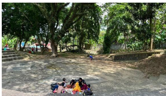
Gambar 3. Kegiatan berekreasi