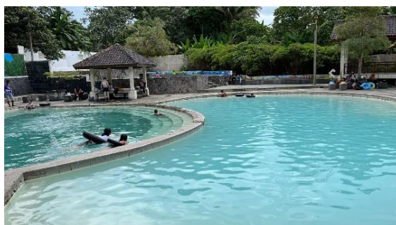
Gambar 5. Pengunjung anak-anak berenang di kolam air tawar