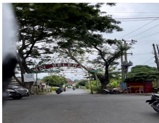
Gambar 12. Jalan masuk menuju Way Belerang