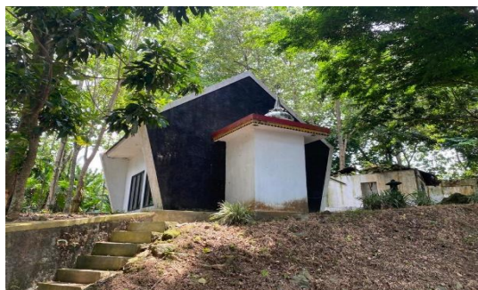
Gambar 10. Musholla