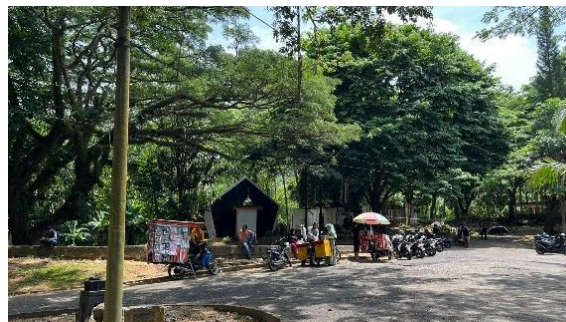
Gambar 2. Pemandangan dan suasana yang asri

4. (iii) Berenang di kolam air tawar, pada wisata ini tidak hanya terdapat kolam air panas saja, tetapi juga terdapat kolam air tawar. Kolam air tawar ini biasanya digunakan oleh anak-anak yang berrekreasi disini untuk sekedar berenang saja. Kegiatan ini dapat dilihat pada Gambar 5.