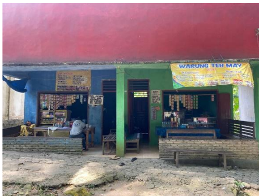
Gambar 8. Warung

Something to buy yaitu sesuatu yang bisa dibeli dan dibawa pulang sebagai kenang-kenangan bahwa sudah berkunjung ke suatu tempat (Buchori 2020) Pengunjung yang berwisata ke Way Belerang dapat membeli oleh-oleh berupa sabun yang terbuat dari belerang yang ada disana. Sabun yang terbuat dari belerang dapat dilihat pada Gambar 6.