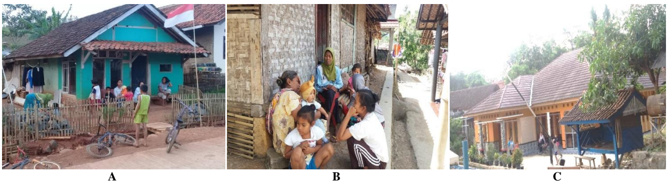
Gambar 2. A-B. Berkumpul dengan tetangga; C. Pekarangan sebagai tempat bermain anak-anak

Pekarangan pun menjadi salah satu tempat bermain bagi anak-anak sekaligus tempat sosialisasi dengan lingkungan disekitarnya, baik dengan lingkungan alam maupun lingkungan sosial. Pada masyarakat Desa Mekarasih, pekarangan masih dijadikan tempat bermain bagi anak-anak, biasanya anak-anak bermain saat sore hari. Seperti bermain bola, bulu tangkis, atau yang lainnya. Selain menjadi tempat bermain bagi anak-anak, pekarangan pun menjadi tempat sosialisasi bagi anak. Sebagai makhluk sosial, setiap individu senantiasa berinteraksi dengan individu yang lainnya dimana dalam proses tersebut terjadi suatu sosialisasi. Orang tua mensosialisasikan nilai dan norma-norma yang berlaku di masyarakat kepada anaknya sehingga anak tersebut dapat menyesuaikan diri dengan lingkungan sekitarnya, seperti saat berkumpul dengan tetangga anak diajarkan mengenai nilai sopan santun dan menghormati orang lain.