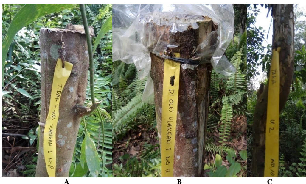
Gambar 2. Kondisi tanaman setelah perlakuan eradikasi

Eradikasi dengan pencabutan menunjukkan periode yang paling singkat yaitu 2,5 menit. Namun demikian eradikasi dengan pencabutan terbatas pada tanaman yang masih muda yang berdiameter \leq 7 cm. Namun demikian apabila tanaman sudah tumbuh menjadi besar > 7 cm tidak memungkinkan dengan pencabutan sehingga perlu dilakukan cara yang lain yaitu dengan pengupasan kulit, penebangan+pengolesan dan penebangan. Dengan demikian eradikasi akan lebih efektif apabila dilakukan sejak dini sebelum tanaman tumbuh menjadi besar.