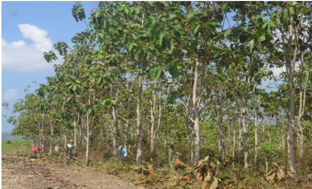
Gambar 1. Tanaman uji keturunan jati umur 10 tahun di Gunungkidul

Dari hasil uji lanjut pada tabel 3, diketahui bahwa rerata diameter batang/dbh terbaik ditunjukkan oleh populasi Mboto dan terendah populasi Warangga. Rerata tinggi pohon juga diperoleh pada populasi Mboto dan yang terpendek pada populasi Warangga dan Buton. Tinggi bebas cabang/TBC terbaik juga diperoleh pada populasi Mboto meskipun tidak berbeda nyata. Demikian pula rerata volume pohon terbaik ditunjukkan oleh populasi Mboto dan terkecil pada populasi Warangga. Hasil penelitian ini menunjukkan famili-famili dari populasi pulau Jawa (Mboto dan Senori) menunjukkan kinerja pertumbuhan lebih yang lebih baik dari 6 populasi lainnya. Hasil serupa juga dilaporkan oleh Hadiyan (2009) bahwa pada uji keturunan jati di Ciamis Jawa Barat diperoleh rerata pertumbuhan terbaik dengan sumber benih dari Pulau Jawa yaitu dari Bojonegoro, Ciamis dan Blora meskipun tidak berbeda secara signifikan.