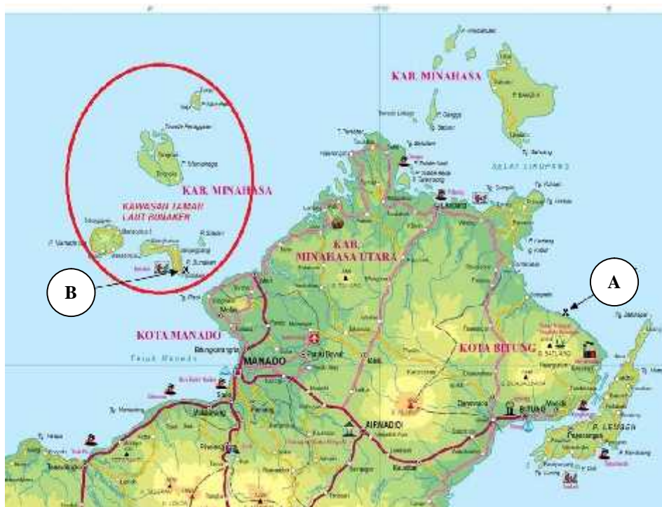
Gambar 1. Lokasi pengambilan sampel di kawasan mangrove: A. Pantai Sampiran, dan B. Pulau Bunaken, Sulawesi Utara.

Jamur endofit diisolasi dari tumbuhan mangrove menggunakan teknik direct planting yang dikemukakan oleh Nakagiri et al. (2005). Organ tumbuhan sehat seperti akar, daun dan ranting terlebih dahulu dicuci dengan air kran hingga bersih kemudian dipotong 1 cm x 1 cm. Potongan dari masing-masing organ tumbuhan ditempatkan secara terpisah di dalam botol jam dan disterilisasi dengan alkohol 70% selama 1 menit dan pemutih (mengandung 5,3% natrium hipoklorit) selama 2 menit. Potongan bagian tumbuhan kemudian dibilas dengan air yang telah disterilisasi sebanyak 3 kali dan dimasukkan ke dalam tissue tebal steril selama 3-4 jam (sampai kering). Isolasi jamur endofit dilakukan dengan teknik direct planting , yaitu dengan meletakkan bagian tumbuhan yang sudah kering (5-6 potongan) di atas permukaan agar 2% medium yang telah ditambahkan kloramfenikol (200 mg / 1 liter medium). Seluruh medium yang telah diinokulasi kemudian diinkubasi pada suhu ruang (27-28°C). Morfologi koloni yang penampilan, warna dan ukurannya sama dianggap isolat yang sama; dan setiap koloni representatif dipisahkan menjadi isolat-isolat tersendiri.