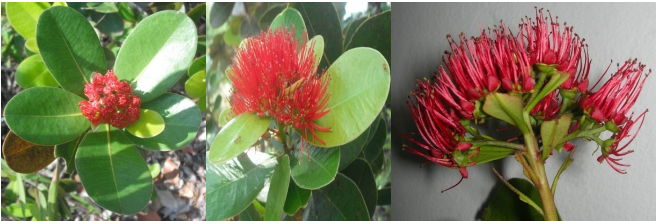
Gambar 3. Perbungaan sowang. Bunga yang masih menguncup (kiri), bunga yang telah mekar (tengah), perbungaan sowang yang memperlihatkan unit perbungaan (kanan).